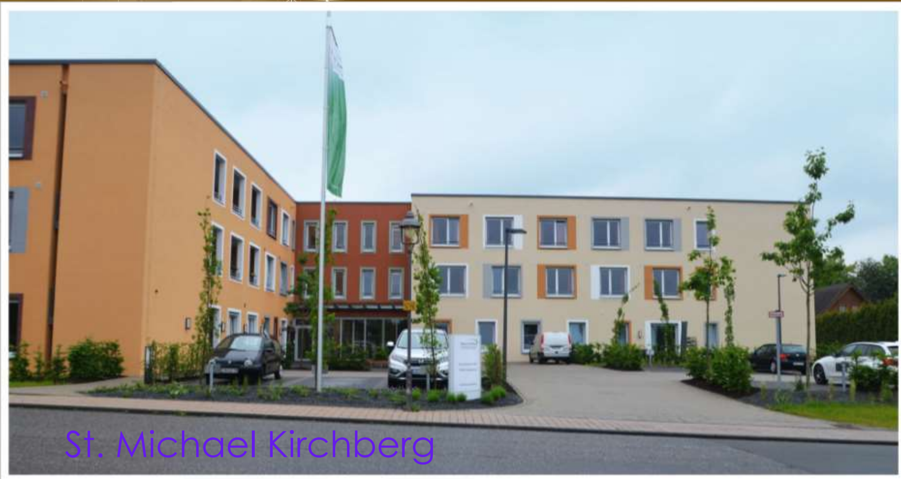
St. Michael Kirchberg